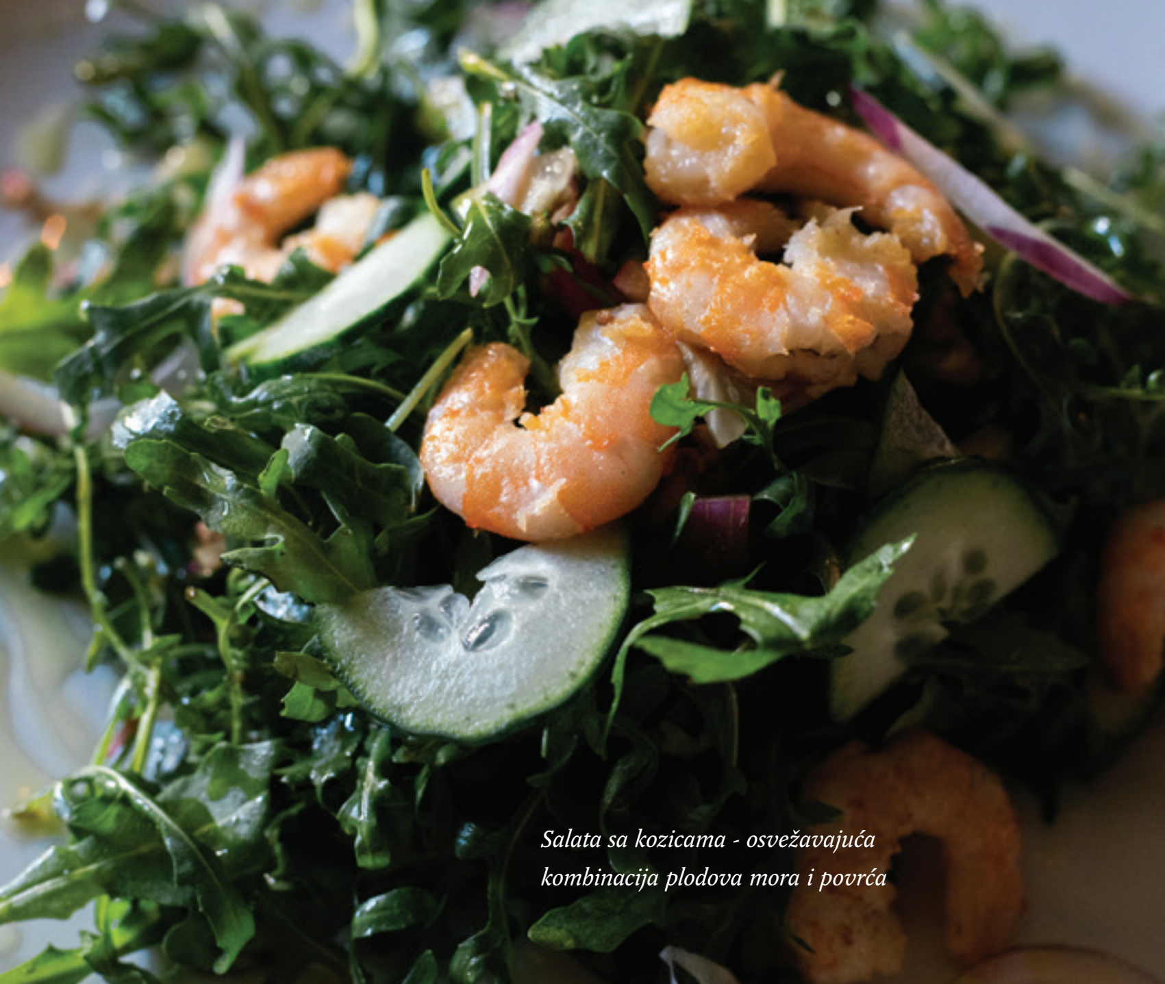
Salata sa kozicama - osvežavajuća kombinacija plodova mora i povrća